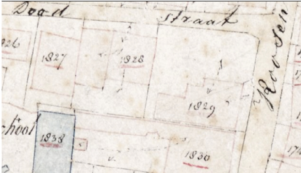
Uitsnede kadastrale minuut 1832 locatie Tusveld Nr. 1829 = Gerritsen, geboren Geesje Wesse, weduwe Gerritsen, weverij, huis en erf Nr. 1830 = Tusveld Jz, Hendrikus, fabrik., huis en erf

Uit eerder uitgevoerd onderzoek is gebleken dat er resten verwacht kunnen worden van stadsboerderijen daterend uit de periode late middeleeuwen en nieuwe tijd: funderingen, uitbraaksleuven, achtererven (waterputten, beerputten en afvalkuilen) en stenen muurtjes. Eventuele archeologische waarden kunnen worden verwacht vanaf circa 90 cm –mv. Onder eventueel aanwezige kelders (verstoringdiepte 2 m –mv) worden geen archeologische resten meer verwacht.